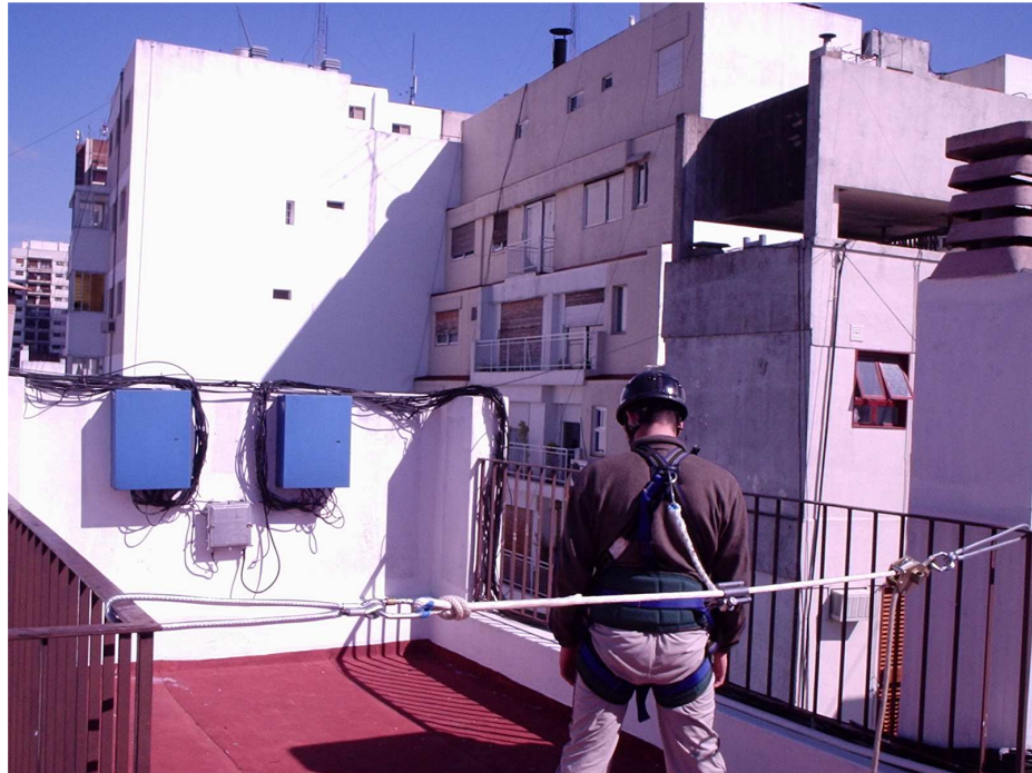
Vista General 2