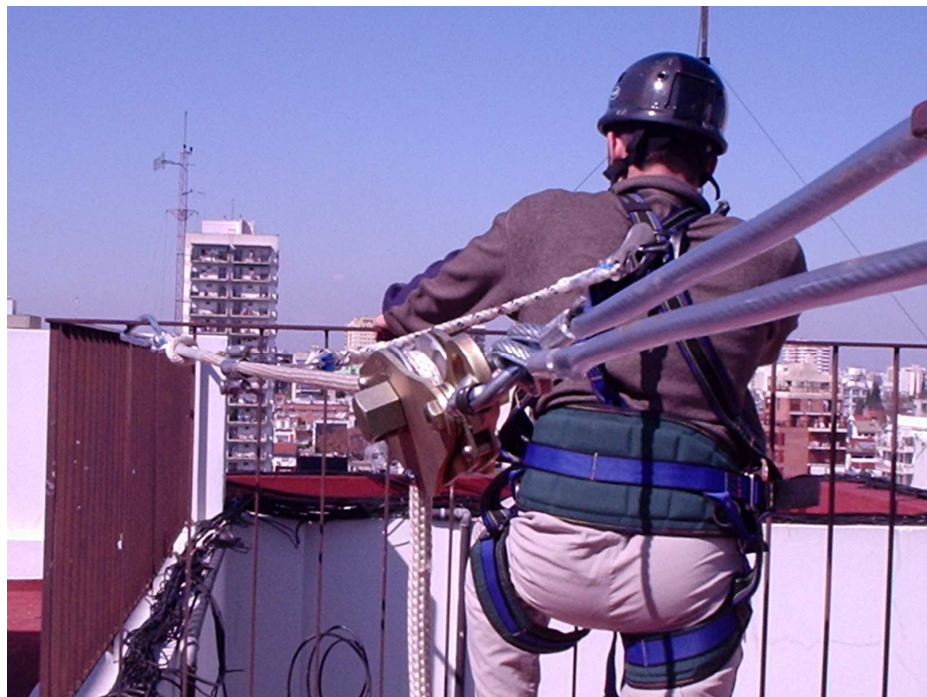
Detalle Extremo Ajustador / Tensor