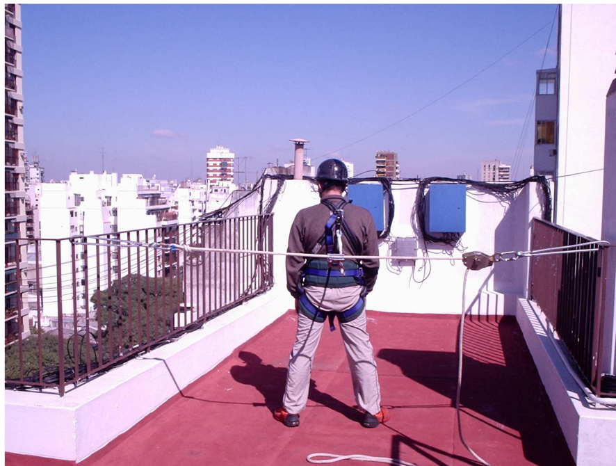
Vista general 1